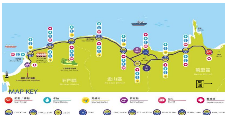
馬拉松競賽路線(圖一)：起點(臺2線48.4km處)出發→臺2線(經萬里隧道)→環金路→臺2線→折返點(石門區體育館)→臺2線→左轉磺清路→磺港路→公園路→民生路→加投路→臺2線→終點

馬拉松全長42.195公里限時6小時內完賽，也有距離較短的挑戰馬賽程全長10公里限時1小時50分鐘內完賽。每一年開跑前，都會在路邊見到來熟悉跑程及調整身體狀況的參賽者，由此可知，此馬拉松對於參賽者是一項在台灣具挑戰性的賽事。睽違一年，「2022新北市萬金石馬拉松」第20屆於111年3月20日（週日）在萬里區翡翠灣登場，總計有來自國內、外選手超過11,000名跑者參賽。