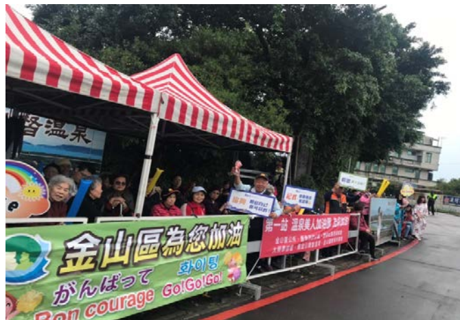
最盛大的國際馬拉松賽事，跑者不同凡響以外，加油區也是不惶多讓喔