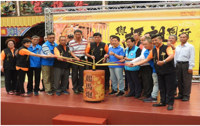
二媽回娘家開跑囉，祈求著一路平安