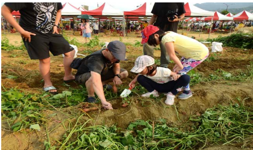
親身體驗農作樂趣及辛勞，讓孩子知道食物的得來不易，要惜福珍惜。