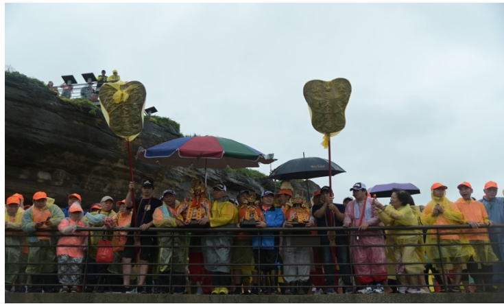
雨天也不停歇呢，風調雨順。