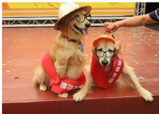
最虔誠的毛孩子們，他們也需要被保佑的喔