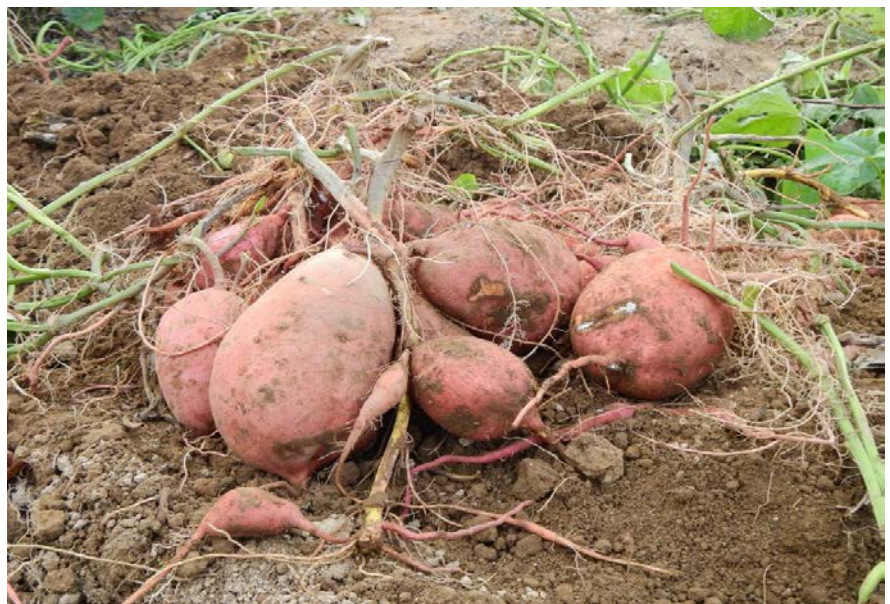
這份量不小呢，獎落誰家呢!