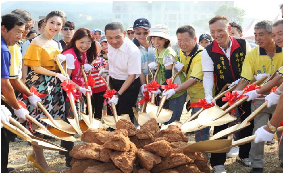
有侯市長坐鎮，天氣好的不得了。