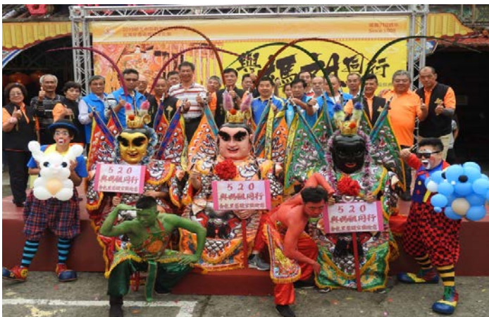
保護著我們最珍貴的資產"文化"並傳承下去。