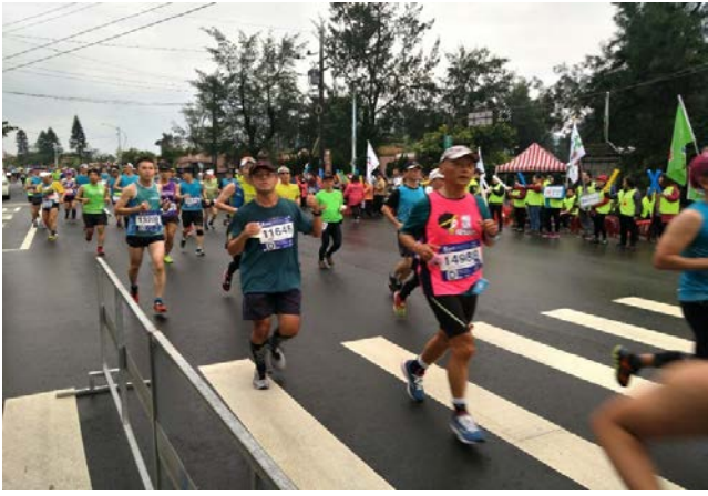
加油聲響徹雲霄，應援隊也很重要。