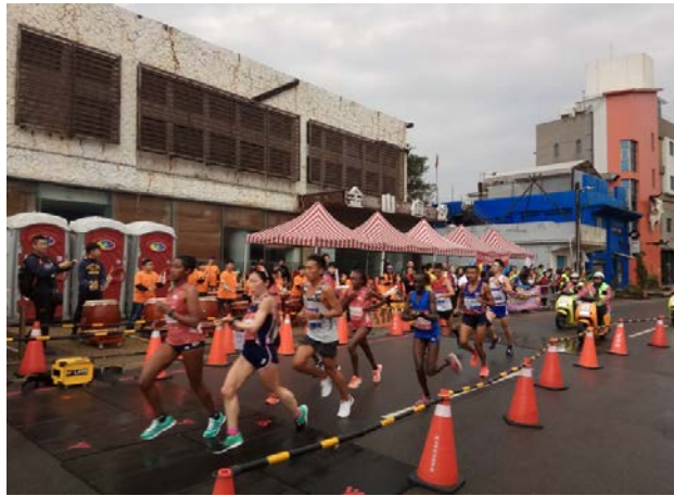
來自各國的選手，不管與天晴天，大家都很賣力的投入這項體育活動